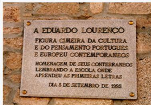
Placa colocada no recreio da escola primária de S. Pedro do Rio Seco

Eduardo Lourenço nasceu em São Pedro de Rio Seco (Almeida) a 23 de Maio de 1923. Frequentou o Liceu da Guarda e cursou Ciências Histórico-Filosóficas na Faculdade de Letras da Universidade de Coimbra, fazendo-se já sentir da sua parte uma atitude crítica e um pensamento autónomo. Após o curso, licenciou-se nessa faculdade como professor assistente, iniciando a sua colaboração em revistas como a Vértice , onde se estreou com um poema e onde foram publicando os ensaios mais tarde reunidos em Heterodoxia I , numa primeira edição de autor, em 1949.