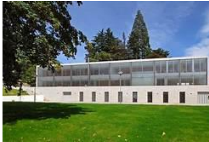
Biblioteca Municipal Eduardo Lourenço - Guarda