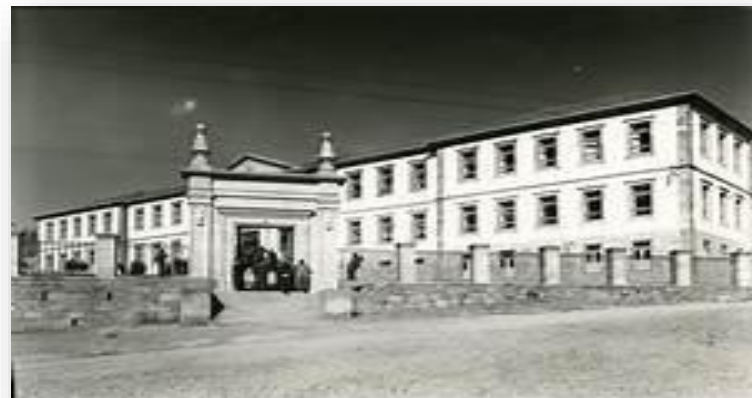
Edifício do antigo Liceu da Guarda