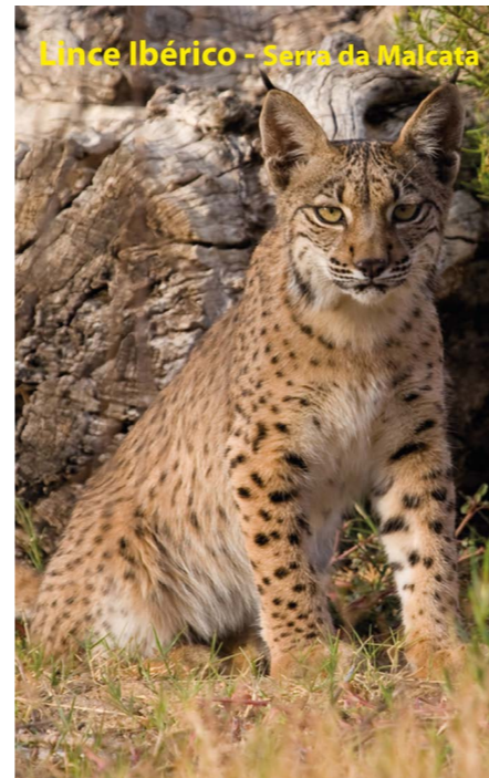
Lince Ibérico - Serra da Malcata