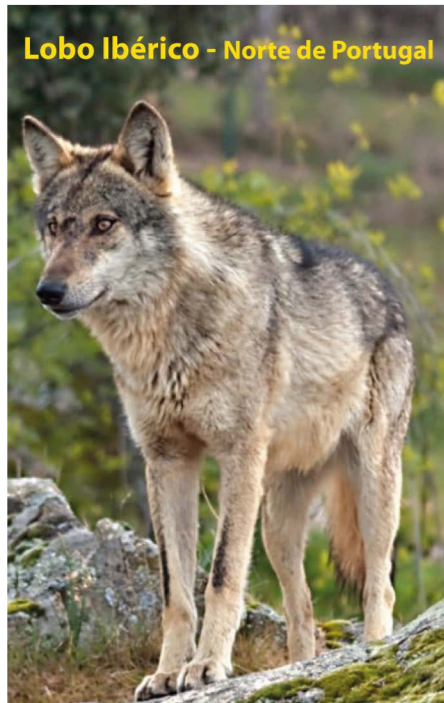
Lobo Ibérico - Norte de Portugal