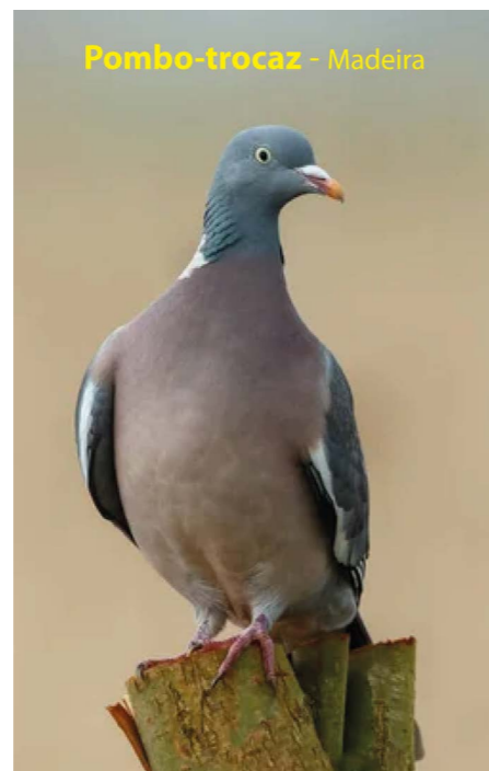
Pombo-trocaz - Madeira