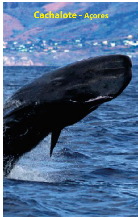
Cachalote - Açores