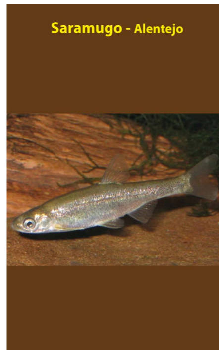
Saramugo - Alentejo