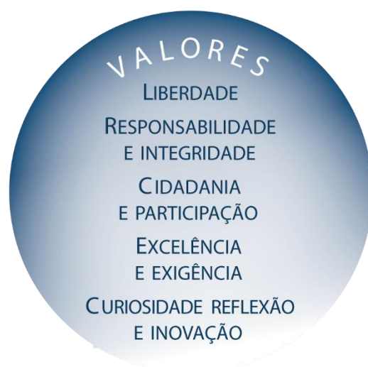
Fig. 2 Valores